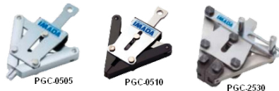
PGC - Pinces de traction automatiques