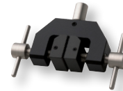
GC - Pinces de traction