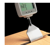
DF - Crochet plat