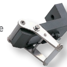
GC - Pinces pour matière élastique