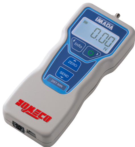
DST (remplace DS2)

Les dynamomètres digitaux sont conçus avec une cellule de charge intégrée. Avec un dynamomètre digital, la mesure est affichée sous forme de chiffres, donc pas d'erreur de lecture, elle est identique pour tout le monde. De plus, ayant une fonction de communication, il peut être connecté à un périphérique externe (ordinateur, clef USB, Banc, ...) pour une application particulière, ou tout simplement pour une gestion et une analyse détaillée des données. Les logiciels optionnels compatibles permettent d'obtenir l'acquisition ou la représentation graphique des données, ainsi qu'une gestion des fonctions des dynamomètres.