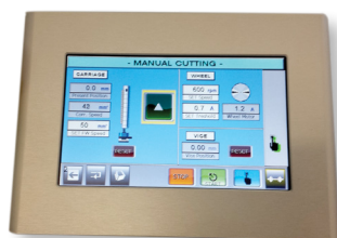
Ecran tactile couleur