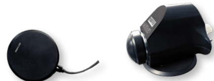
Chargement sans fils