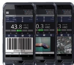
Interface paramétrable : Images, localisation GPS, notes, codes barres