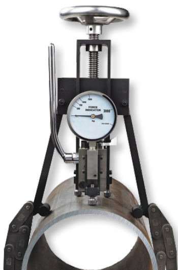
Norme et certification ISO6506-1, ASTM E10

Application hydraulique de la charge Essai BRINELL normalisé, ISO6506-1, ASTM E10.