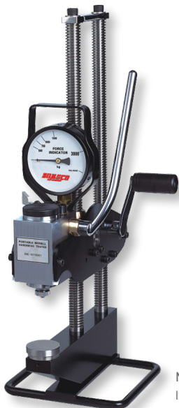
Norme et certification ISO6506-1, ASTM E10

Application hydraulique de la charge Essai BRINELL normalisé, ISO6506-1, ASTM E10.