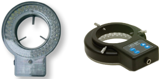
LE.1974 - 72 LEDs