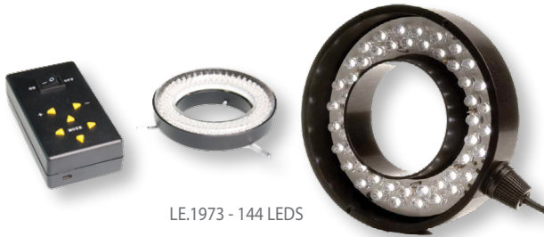
LE.1973 - 144 LEDs