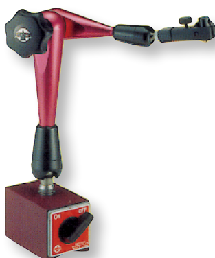
ECE 330 B Système articulé à blocage central mécanique avec réglage fin