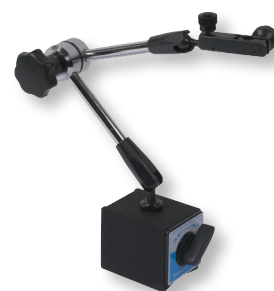
MB4 Système à blocage central mécanique avec réglage fin