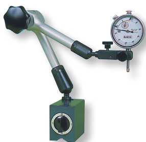
ARTIMAG Système articulé à blocage central mécanique Avec réglage fin