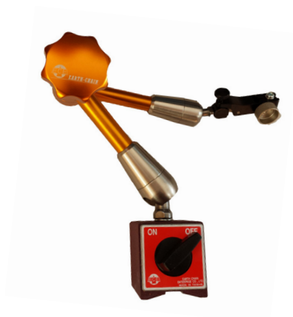
ECE 300 B Système articulé à blocage central hydraulique. Avec réglage fin