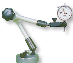
AIRMAG Système à ventouse pour utilisation sur surface non magnétique Blocage central mécanique Avec réglage fin