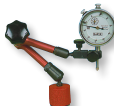
ARTIMAG-MINI Avec aimant permanent Blocage central mécanique Avec réglage fin