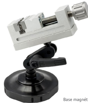
Base magnétique pivotante