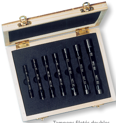
Tampons filetés doubles

Coffret de 7 tampons filetés doubles 6H : M3 - M4 - M5 - M6 - M8 - M10 - M12