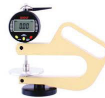
DMD avec col de cygne 100 mm