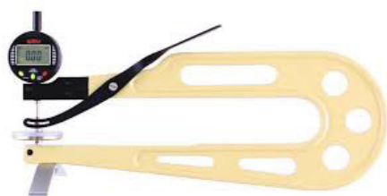
DMD 830 avec touches I et pied support