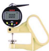
DMD 3 avec touches C