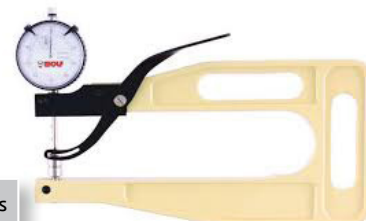
DMH 820 avec touches B

* Références non stockées, délai 15 jours ouvrés