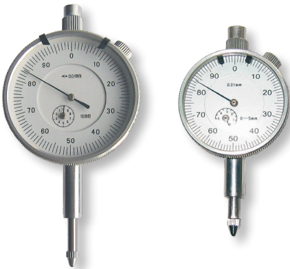
Comparateur à cadran - série "ECO"