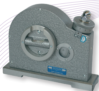
Livré en coffret

Niveaux à bulle et vis micrométrique pour la mesure précise de toute inclinaison. Base prismatique en acier trempé et rectifié pour mesurer l'inclinaison des surfaces ou des cylindres.