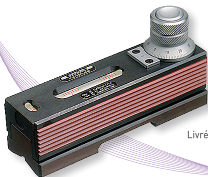
Livré en coffret

Base prismatique en acier trempé et rectifié pour mesurer l'inclinaison des surfaces ou des cylindres.