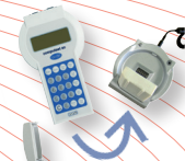
Chargement de la batterie interchangeable sur socle