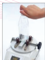
Mesure de couple, ouverture de bouteille